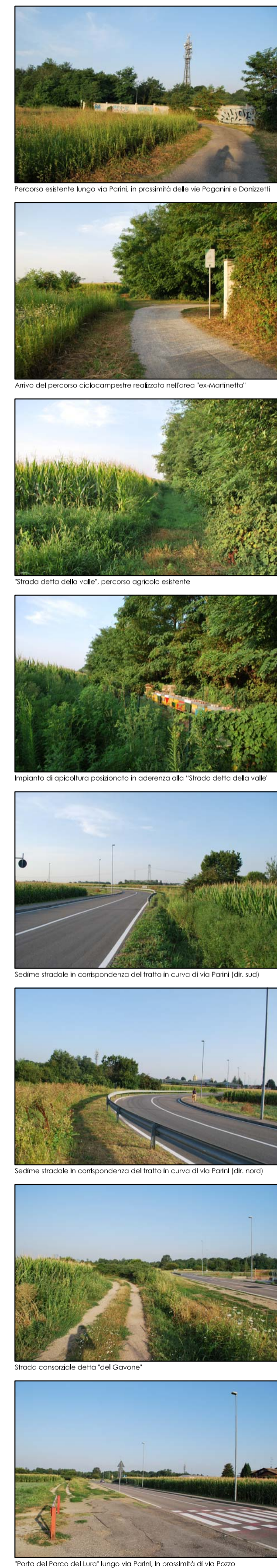
Parco esistente lungo Via Parini in prossimità della Via Roggione e Donzelli