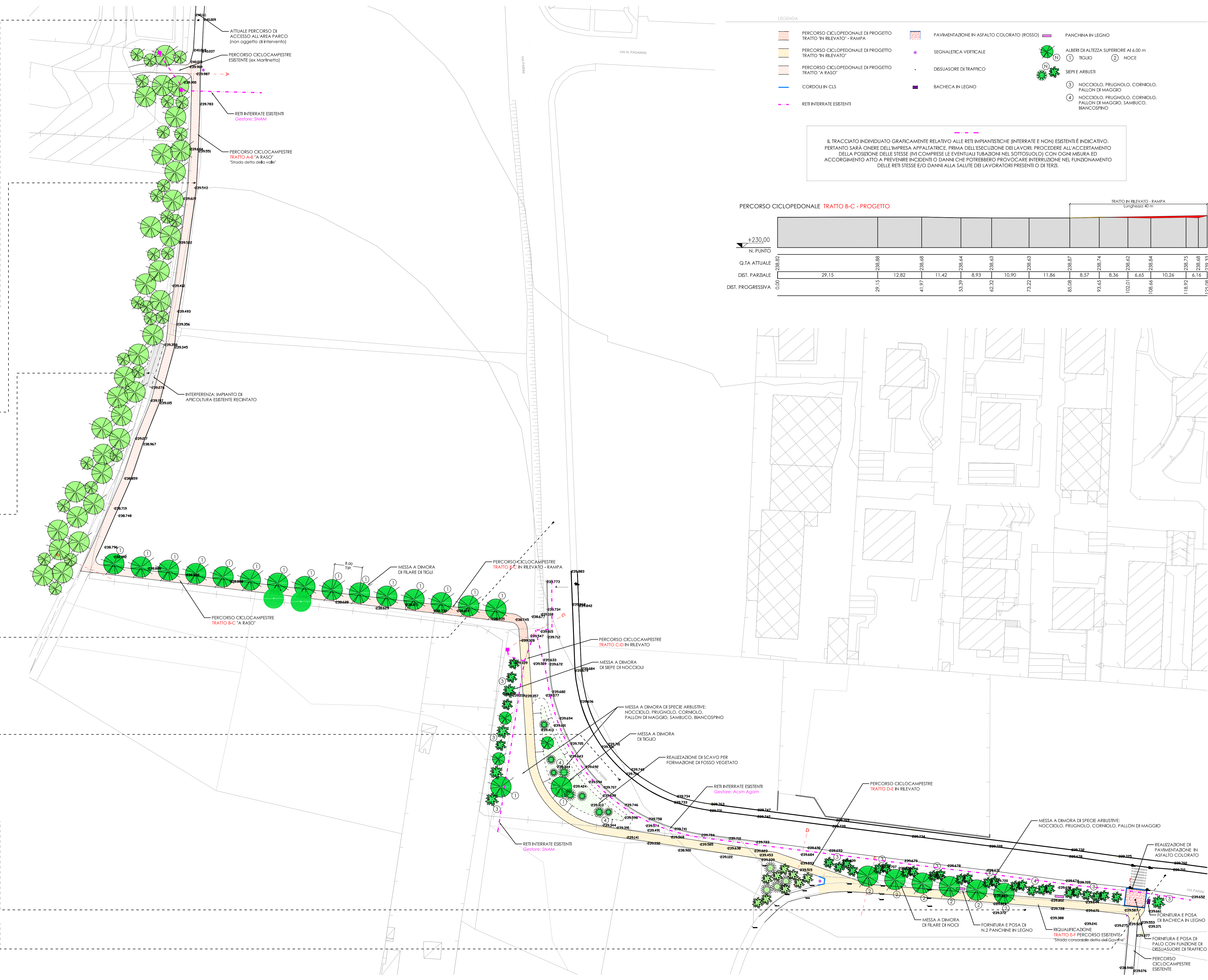
Porto del Parco del Lura - Lungo Via Parini in prossimità di Via Pozzo