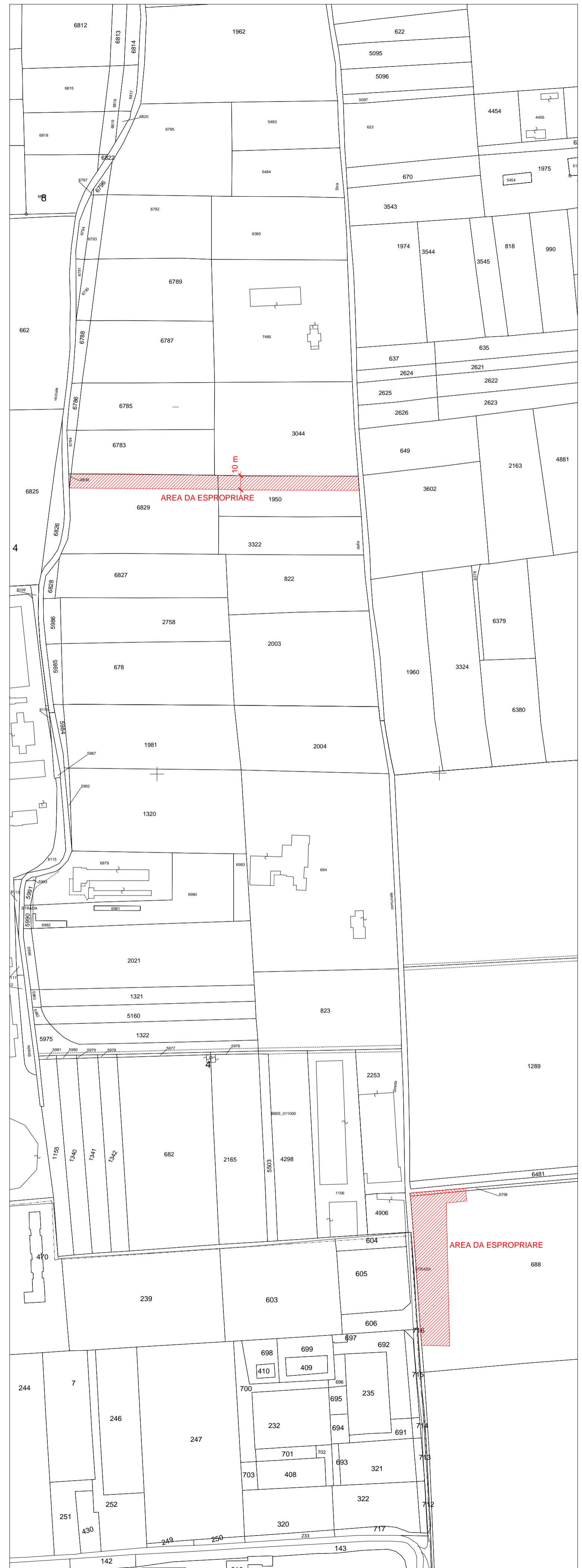
MAPPA CATASTALE - 1:2000